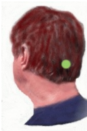
Illustration du point occipital

Une séance réussie d'EFT se termine toujours dans une grande sensation de paix intérieure et de liberté nouvelle. Un moment parfait pour donner de nouvelles directives à son subconscient, par le biais de ce que l'on nomme "l'Assertion du positif par le tapping sur le renflement occipital".